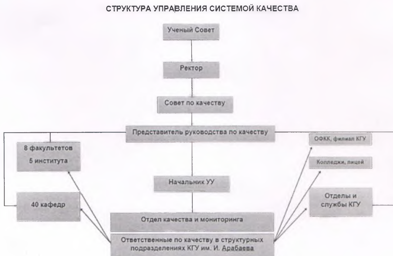
Рис. 1. Структура управления в СМК

Структура управления в СМК КГУ представлена на рис.1.